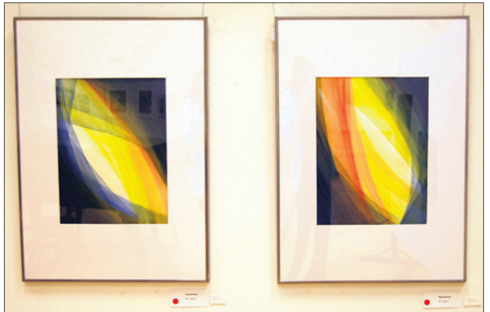
Pohjois-Haagan Yhteiskoulu lunasti kaksi Anja Oasmaan akvarellia, nimiltään Lupaus 1 ja Lupaus 2.