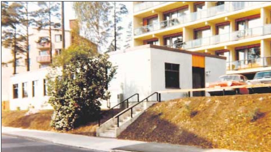
Haga Ungdomsförenings nya hus vid Haga Sportväg 5. Haga Ungdomsföreningin uusi talo vanhan paikalla.

bergsdagsfester, Svenska-dagsfester och sommarfester, där den egna sångkören och