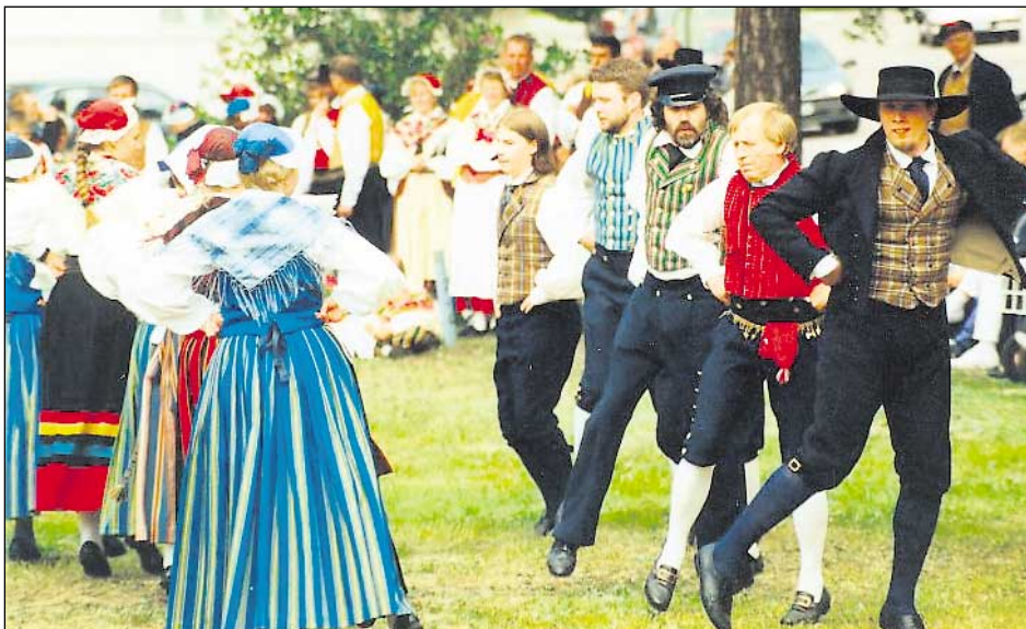
Uppvisning i Hangö 2001. Kansantanssia Hangossa 2001.