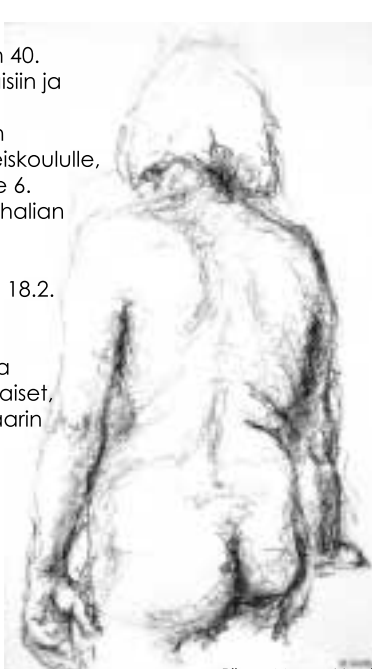
Piirros: Mauno Vuori