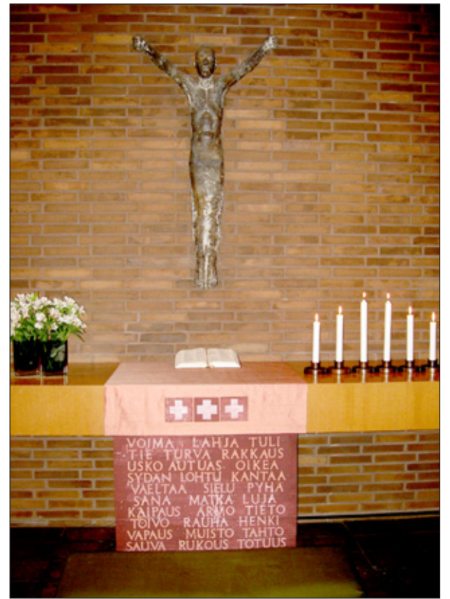
Helluntain alttari uusine kirkkotekstiileineen. Seuraavan kerran punaisia alttarivaatteita voi ihailia Apostolien päivän messussa 22.6.

koottu sanoja, joista kukin toivottavasti löytää jonkun tai joitakin mukaansa matkalleen. Stolissa on risti, joissa voi yhtä aikaa hahmottaa ankkurin ja ristin, uskon ja toivon merkkeinä. Kalkkiliinaan on ikuistettu