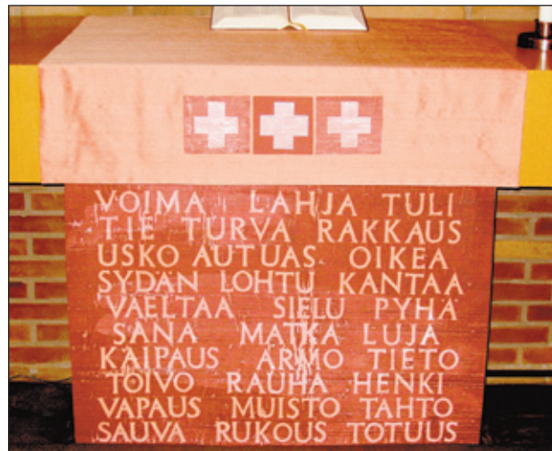
Lähikuva punaisesta antependiumista.

teksti: Päikki Priha