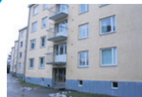
Kt 2 h + k + lp, 52 m 2 , vh. 135 t. Ida Aalbergin tie 4 T P-Haaga

LKV HESTIA OY Kauppalantie 42 puh. 09-4369 4650 GSM 050-305 9812 www.lkvhestia.com Väl.palkkio huoneistot 3% +alv 22% tai sopimuksen mukaan.