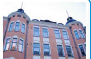
Kt 3 h + k + s, 62 m 2 , vh. 351 t. Kalevankatu 33, Kamppi