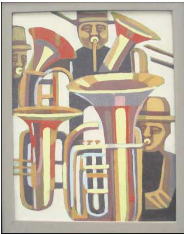
Erkki Toiviasen ”Suut messingille”, öljy 1987.

kaissut henkilömatrikkelin, joten tämä kirja ei kerro historiaa vaan antaa katsojan silmien levätä kuvissa. Kirjaa voi tilata seuran jäseniltä tai puheenjohtaja Mustoselta (0400 519729). Kirjan hinta on 20 euroa.