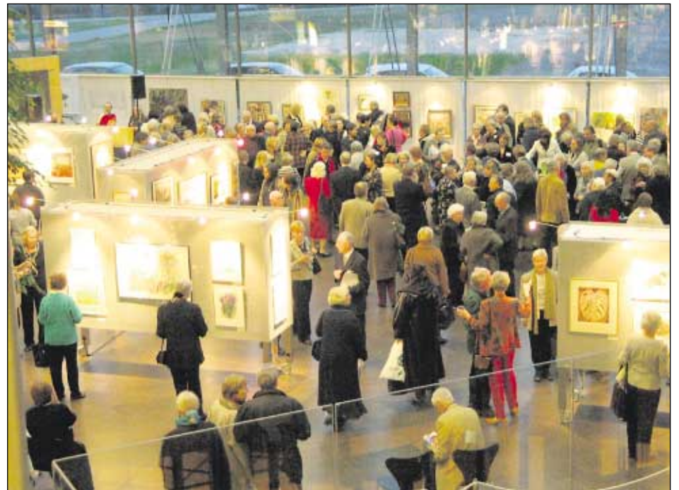
Haagan Taideseuran näyttelyn avajaiset täyttivät Sanomatalon Mediatorin.

Haagan Taideseura käsitte aikanaan useamman taiteen alan edustajia, oli mm. kirjailijoita ja laulajia. Nytemmin taideseura n jäsenkunta on pelkästään kuvataiteilijoita. Jäsenkunnassa on sekä harrastajia että kuvataiteen ammattilaisia. Jäsenkunnan ikärakenne on laaja, kuten edustettuina olevien ammattialojenkin kirjo. Seuran toimintaan