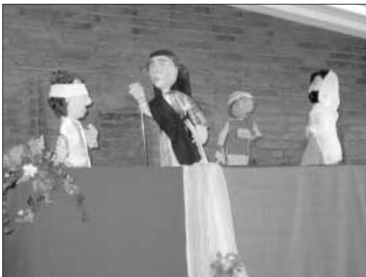
Yhteyttä yläkertaan keppinukien avulla. Sokea pyytää Jeesusta parantamaan itsensä. Keskellä olevat ope- tuslapset ovat ihmeissään. Kevään nukketalkoissa tehdyt keppi- nuket esiintyivät ensi kertaa kirkkokahveilla 11.9..