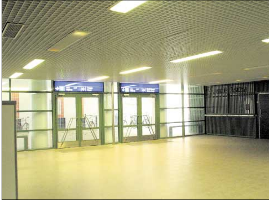
Huopalahden aseman portaikot ja tunneli koetaan pelottavaksi paikaksi.

Alun perin YKS-projektiksi nimetyssä toiminnassa lähdetään siitä, että ympäristön siisteys ja kodikkuus vaikuttavat ihmisten käyttäytymiseen. Huonosti hoidetussa ja epäsiistissä ympäristössä tapahtuu tämän logiikan mukaan vähemmän rikkeitä ja rikollisuutta kuin siistissä ja hoidetussa ympäristössä. Sanasta ympäristö on kotoisin lyhenteen Y. Saman ajattelutavan mukaan kommunikatiivinen lähiyhteisö vähentää ensin rikospelkoa ja sen